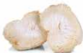
Champignon CRINIÈRE DE LION

Tous les champignons contenus dans la formule inégalée de Moa sont créés grâce à un processus de croissance et de récolte qui amplifie les propriétés saines et antioxydantes des champignons, ouvrant leurs remarquables propriétés.